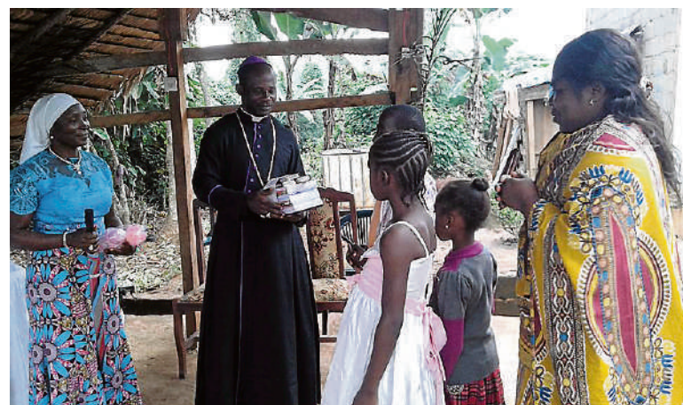
Les enfants de l'orphelinat camerounais de la Communauté Notre-Dame-du-Mont-Carmel de Nkoloulou, à Yaoundé, géré par des missionnaires mariavites, ont reçu récemment des fournitures scolaires grâce aux fonds envoyés par le Groupe d'entraide les Yeux du coeur Canada.